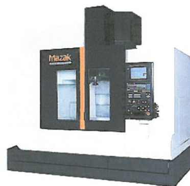
新世代世界標準機 立形マシニングセンタ VERTICAL CENTER SMART 530C