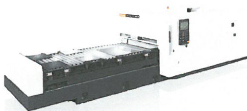
コストパフォーマンスに優れた 2次元レーザ加工機 SUPER TURBO-X2412 Champion