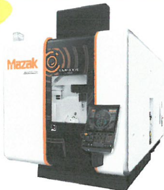
同時5軸加工・高精度多面加工マシニングセンタ VARIAXIS i-700 (Smooth X)