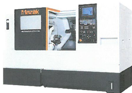
次世代型CNC旋盤 新スタンダードマシン QT-SMART 200