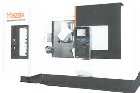
INTEGREXの歴史が動く fシリーズ 複合加工機の新スタンダードマシン INTEGREX F-200S